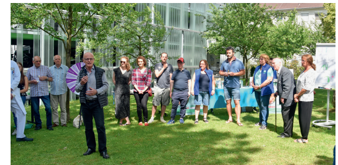
CI-Sommerfest 2019, Klinik und Poliklinik für Hals-Nasen-Ohrenheilkunde/Chirurgie, Bonn

Ort: BECKER Hörakustik, Eingang Hubertinumshof 11, 53173 Bonn-Bad Godesberg